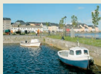
Galway Trendige Hafenstadt.