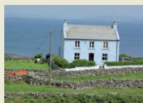
Aran Insel Inis Mor Das urtümliche und gemütliche Insel-Abenteuer.