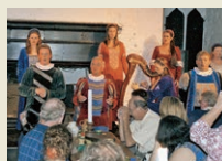
Bunratty Königliches Abendessen im Schloss.