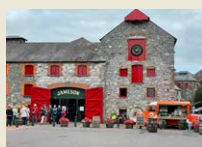
Dublin Aussergewöhnliche Gin- und Whiskey-Distillerie.